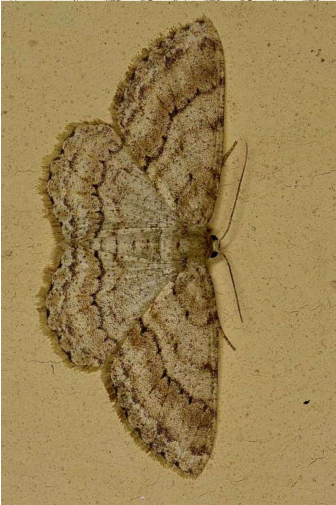
Ectropis crepusculariada (Denis & Schiffermuller, 1775)