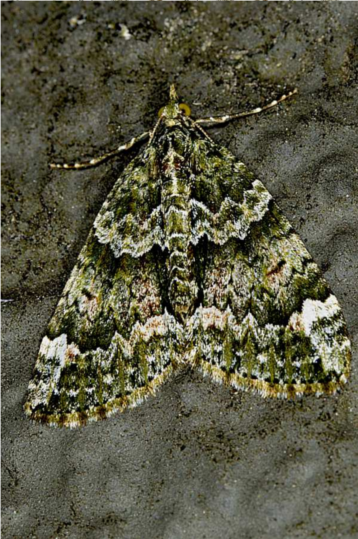
Chloroclysta siterata (Hufnagel, 1767)