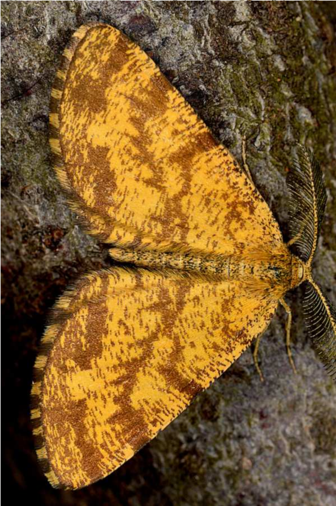
Ematurga atomaria (L. 1758)