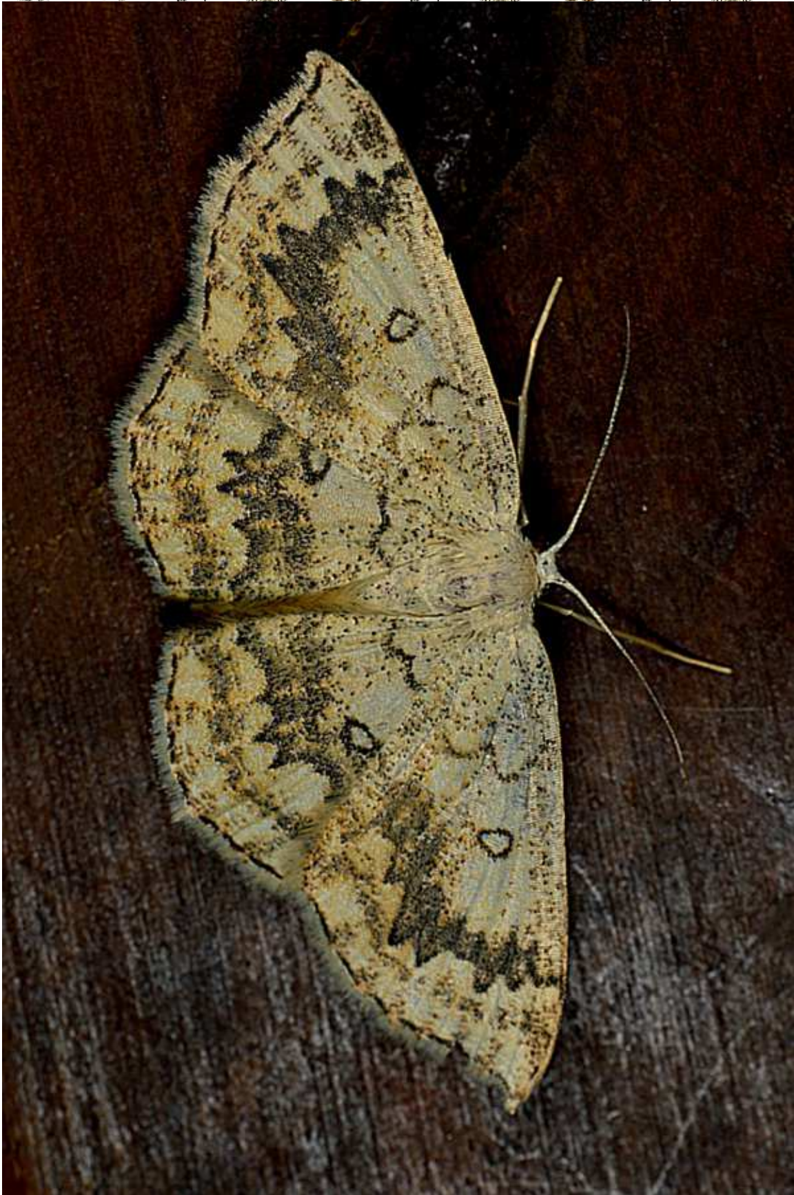
Cyclophora (Cyclophora) annularia (Fabricius, 1775)