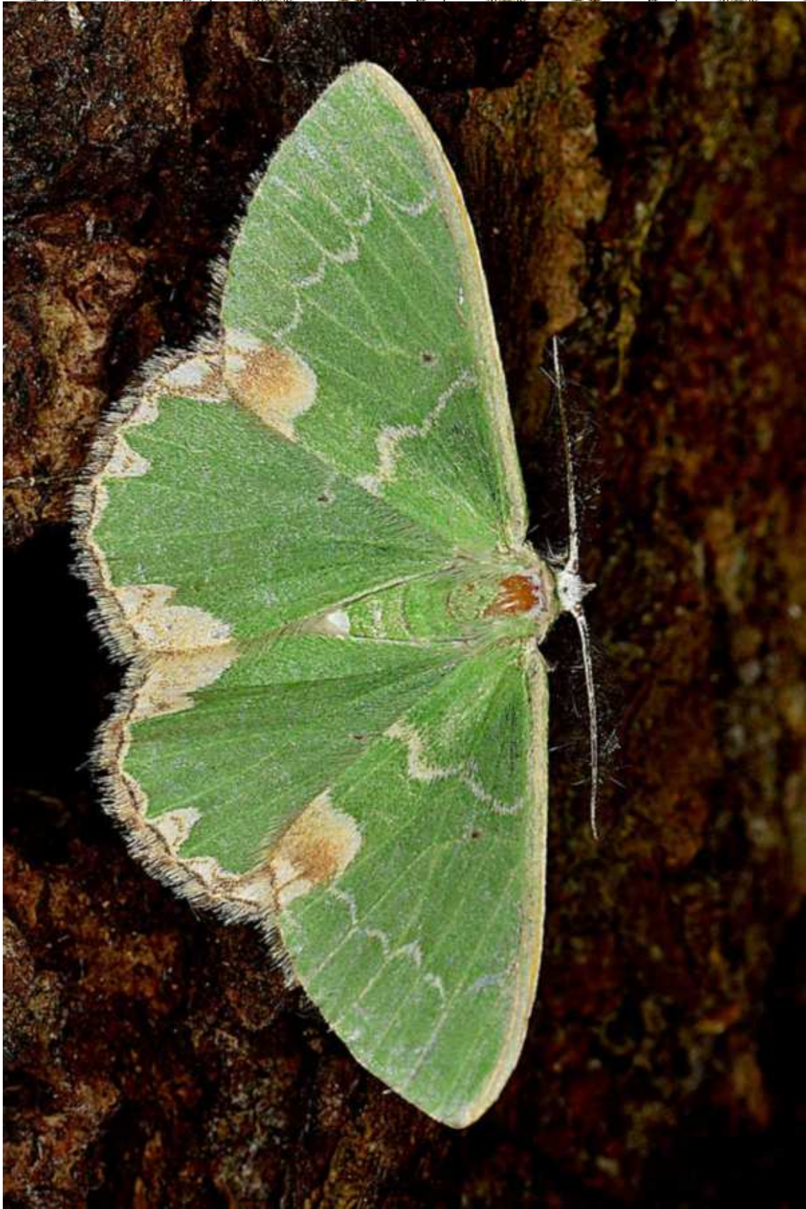
Comibaena bajularia (Denis & Scjiffermuller, 1775)