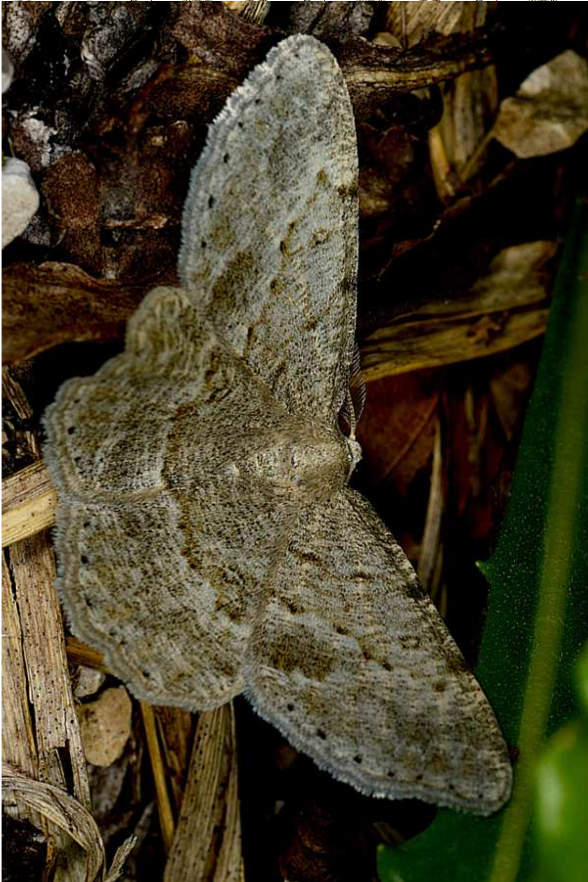
Elophos dilucidaria (Denie & Schiffermuller, 1775)