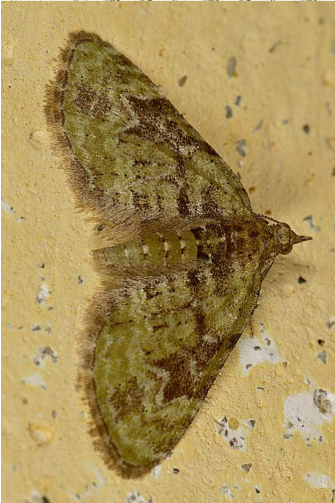
Chloroclystis v-ata (Haworth, 1809)