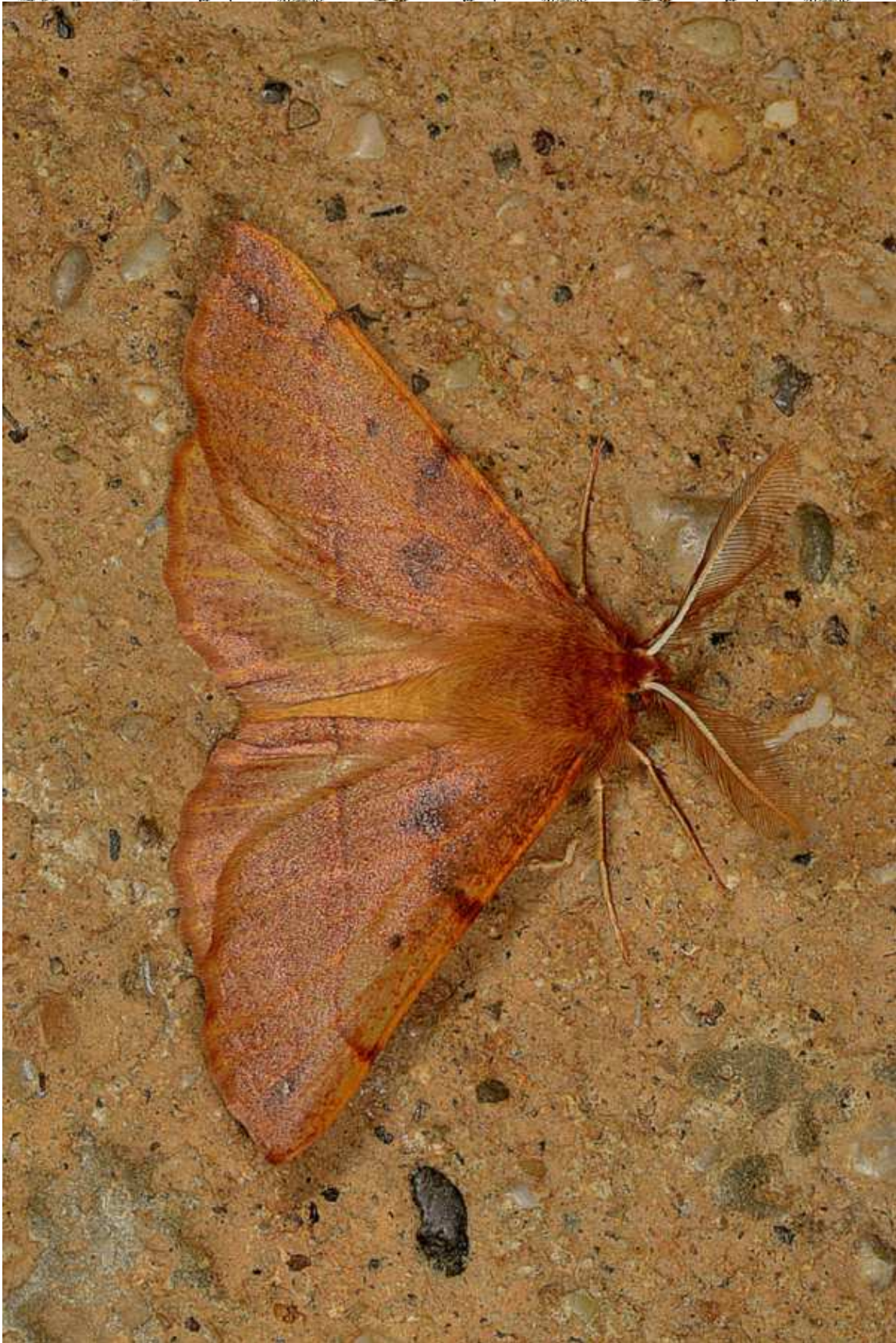
Colotois pennaria (L. 1761)