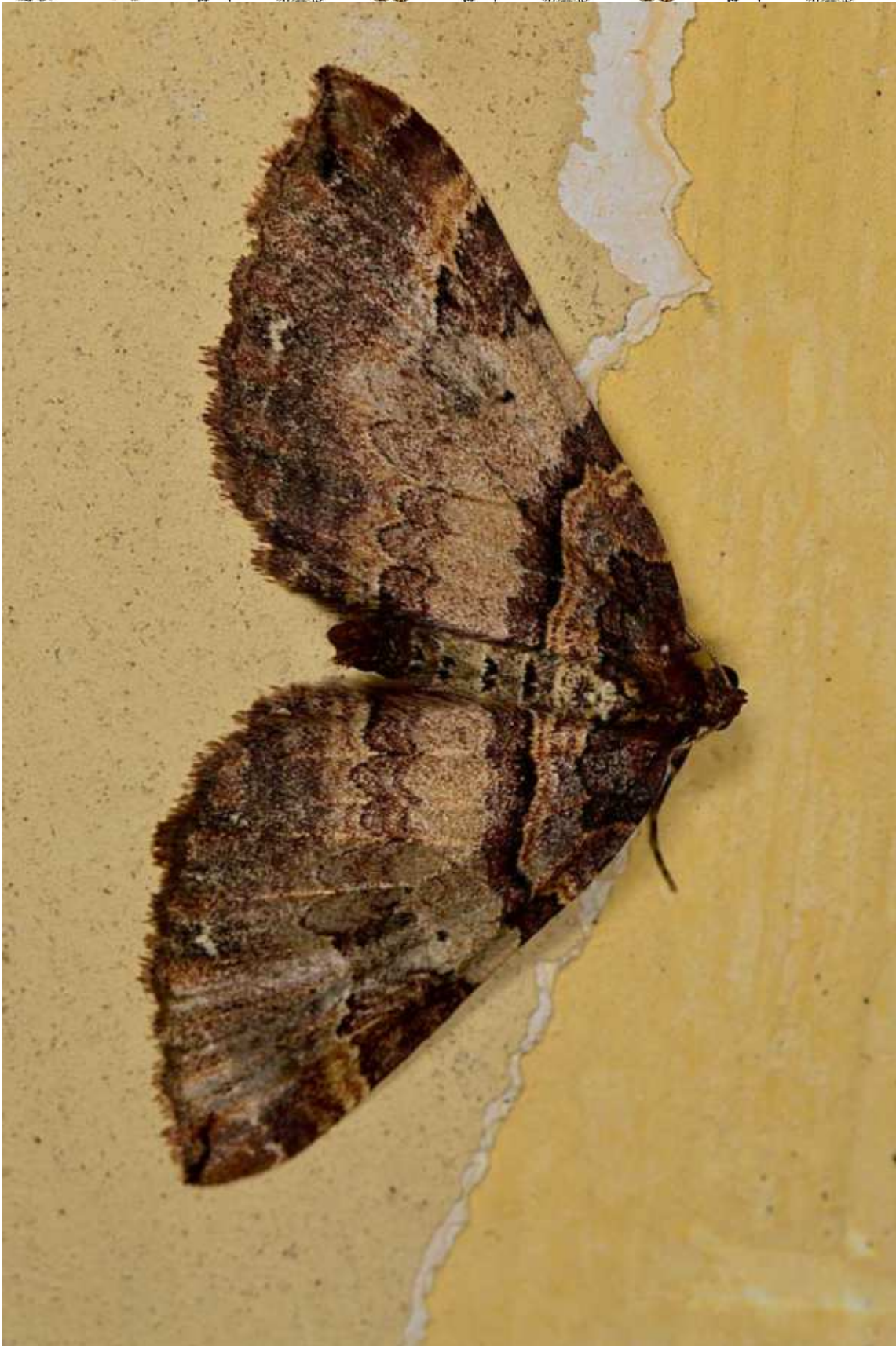
Earophila badiata (Denis & Schiffermuller, 1775)