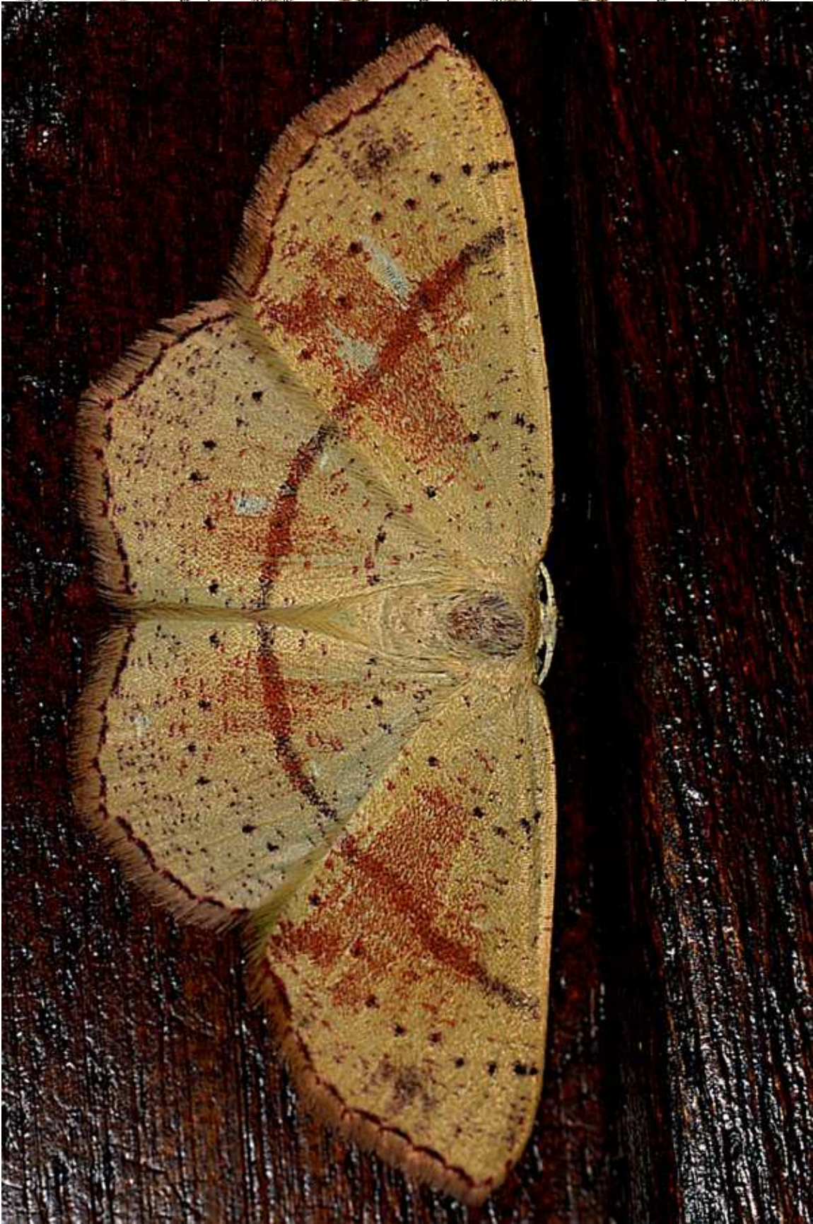
Cyclophora punctaria (L. 1758)